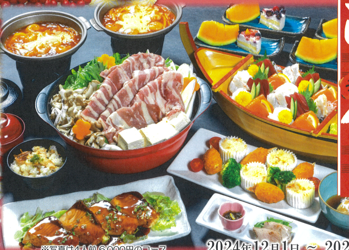
※写真は4人前 6,000円のコース